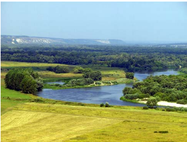
Blick in das Flusstal des Don bei Woronesch

Diwonje Gorje - Wunderbare Berge - werden diese Kreidelfen mit geheimnisvoller Unterwelt genannt. Mönche haben sich hier einst versteckt, Kreuzprozessionen führten durch die Gänge. Die Höhlenkirche wurde in der Sowjetzeit entweiht und schließlich geschlossen. Nun hängen hier wieder Ikonen. Die berühmteste ist die Kopie der Heiligen Madonna von Sizilien. Sie soll Wunder gegen Cholera und schlechte Ernten bewirkt haben.